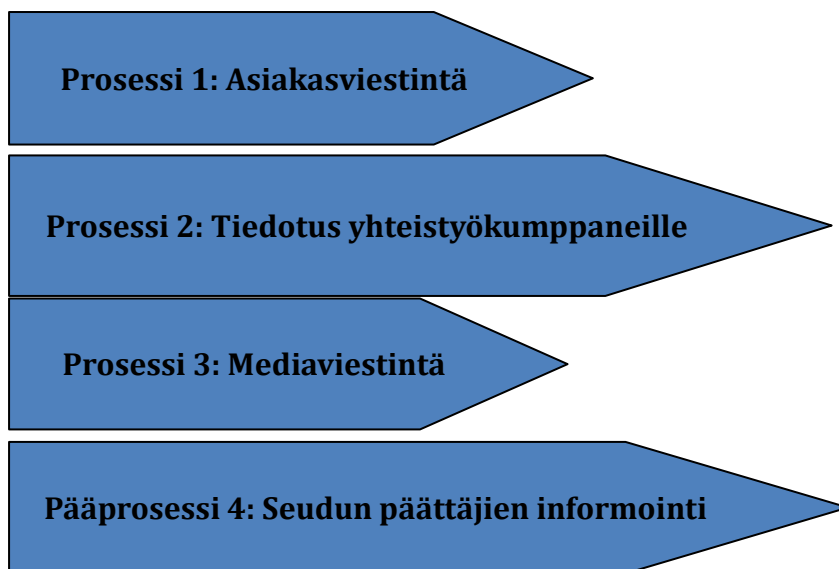
Kuva 3. Joutsenten reitti ry:n viestintäsuunnitelma.

Viestinnän tärkein kohderyhmä ovat Joutsenten reitin hankkeiden toteuttajat (ks. kuva 3). Vuosina 2014–20 jatketaan ”Hanketoteuttajan kansion” postituksia hakijoille heti rahoituspuollon synnyttyä. Kansio ohjaa ja on apuna hankehallinnon arkiaskareissa, mm. arkistoinnissa. Sähköisestä tuki- ja maksuhausta huolimatta paljon materiaalia jää vielä arkistoitavaksi paperilla. Tärkeitä viestinnän kohderyhmiä ovat myös ohjelman julkiset rahoittajatahot, muut yhteistyökumppanit ja seudun päätöksentekijät. Esimerkiksi nuorten osallisuutta pyritään parantamaan kouluissa järjestettävillä info-tilaisuuksilla. Kotisivujen www.joutsentenreitti.fi sisältöä tullaan kehittämään entistä käyttäjäystävällisemmäksi. Niin kotisivuilla kuin muussakin viestinnässä otetaan käyttöön uusi, valtakunnallinen Leader-brändi.